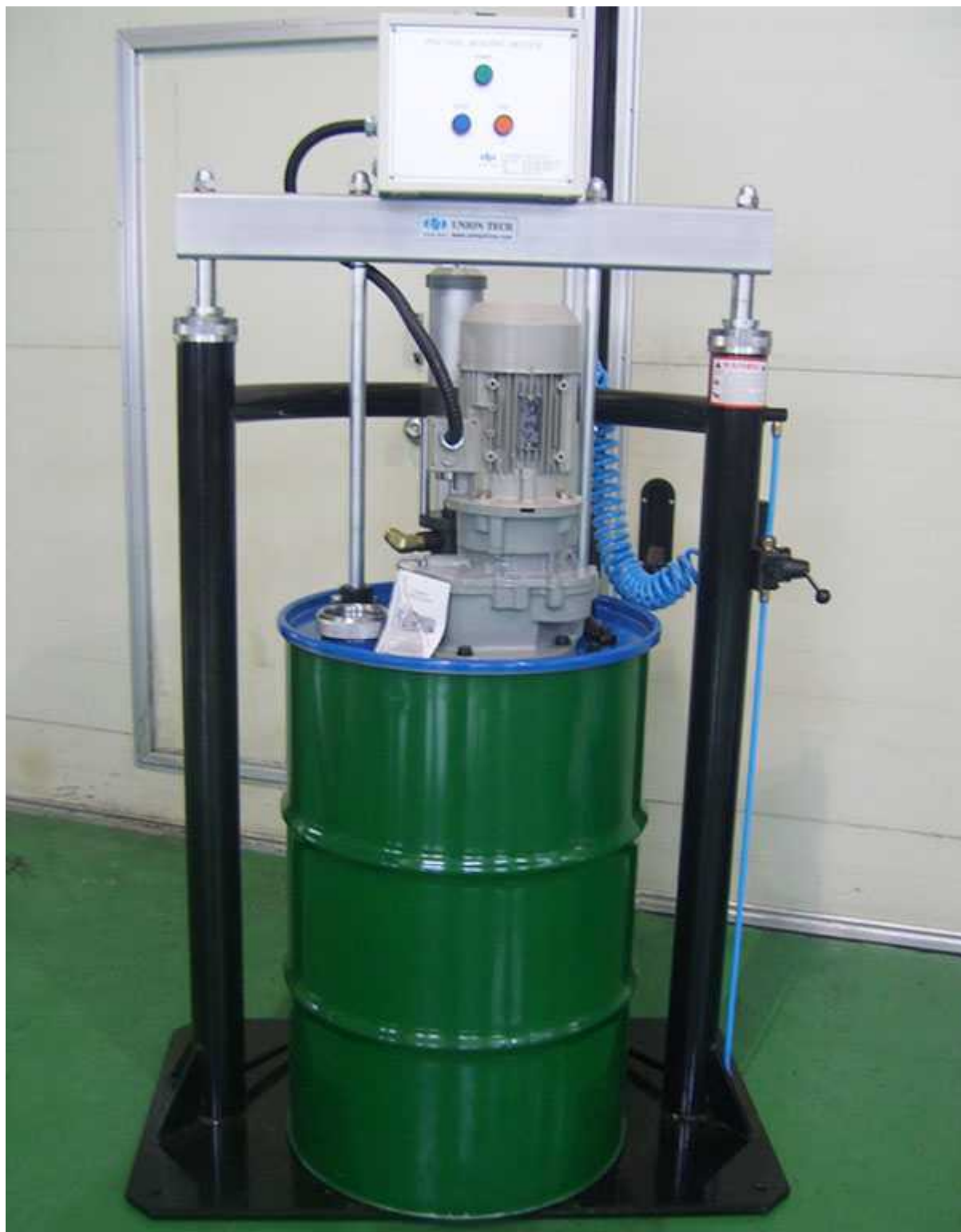
单组份胶料输入泵及搅浑仪