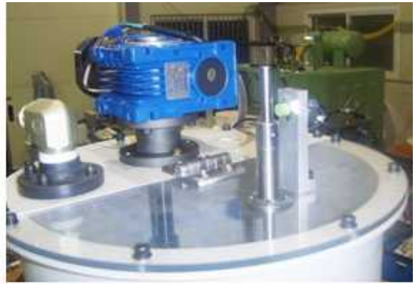
(设备胶桶及搅浑设计)