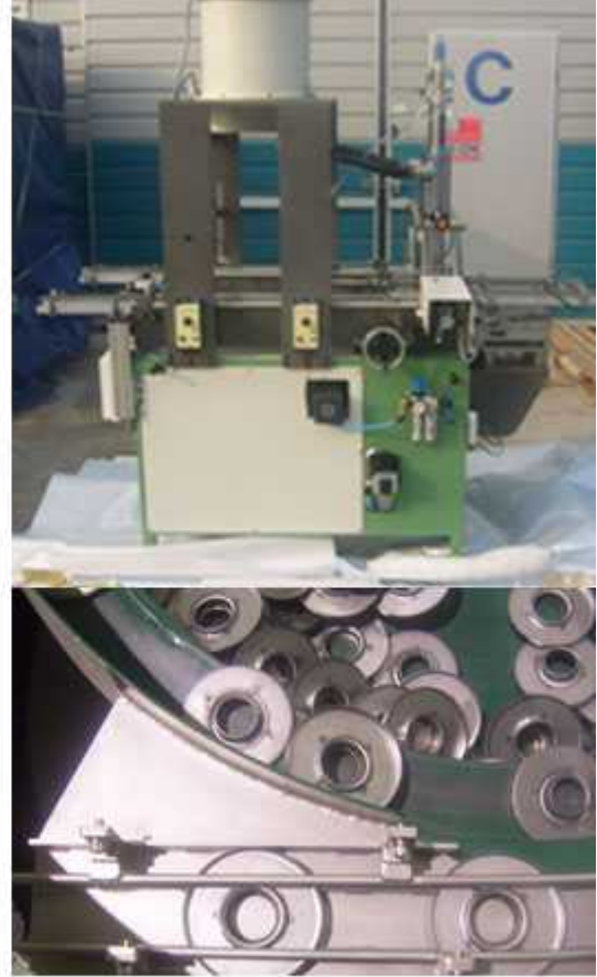
注胶机主机 及 端盖全自动输送系统