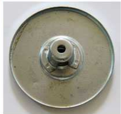
已碰焊的端盖及安全阀卸件